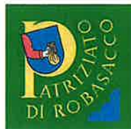
Patriziato di Robasacco

Spettabile Ufficio della caccia e della pesca Via Franco Zorzi 13 6501 Bellinzona